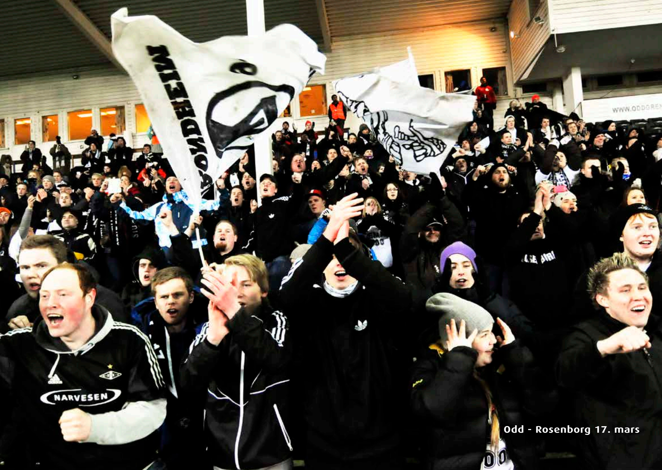
Odd - Rosenborg 17. mars