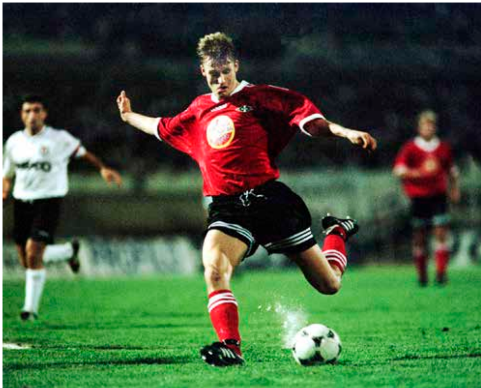
Det avgjørende bortemålet i Istanbul.