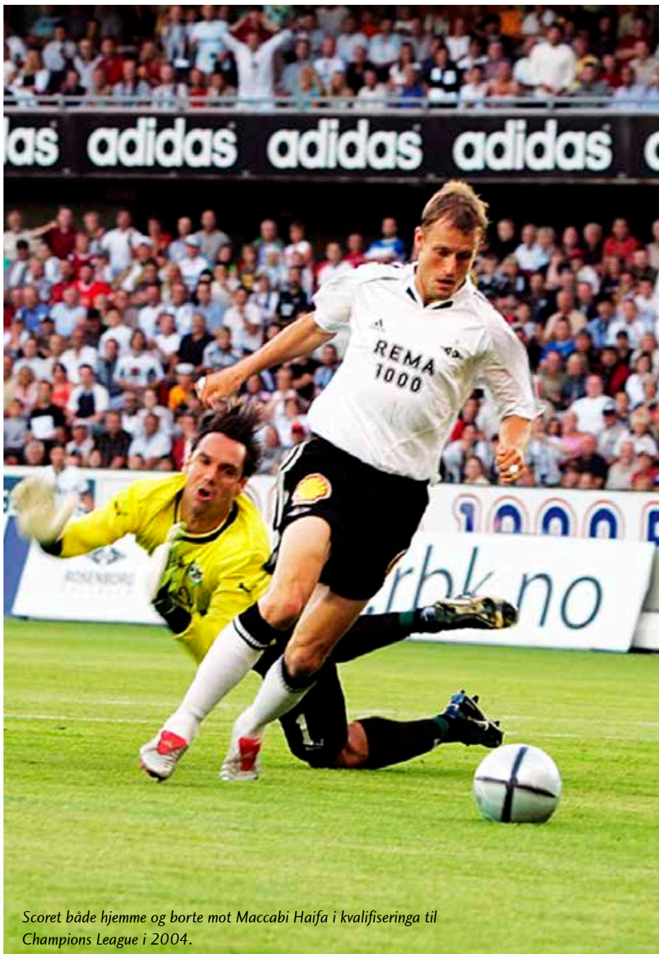
Scoret både hjemme og borte mot Maccabi Haifa i kvalifiseringa til Champions League i 2004.

– Hvordan var det deretter å bli vraket til kvartfinalene mot Juventus?