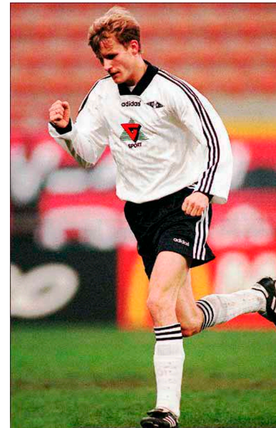
Mål og målgivende pasning på San Siro.